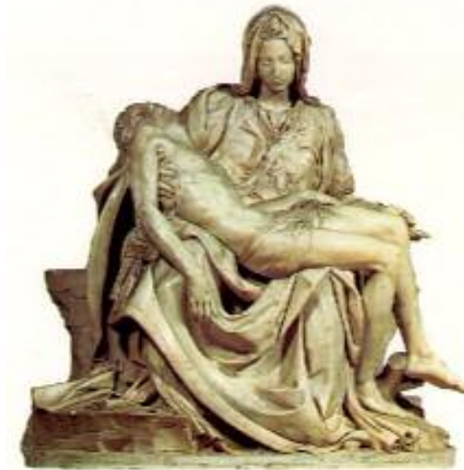
مایکل ئەنجیلۆ/ پەیکەری بەزەیی S/ Pieta